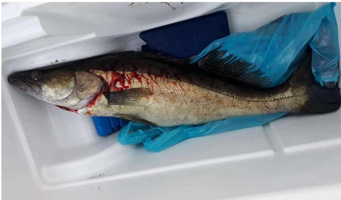
Olavin uistelukuha 3,25 kg