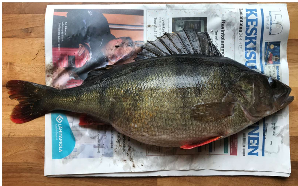
Joukon ennätysahven 1,85 kg