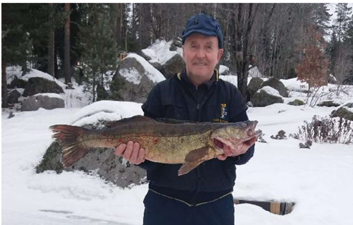
Pertin verkkosaalis: kuha 5,5 kg